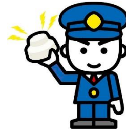
推進シンボルキャラクター「消太」